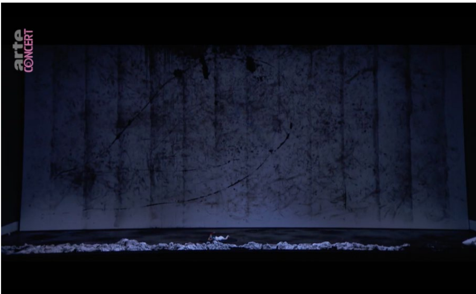
Fig. 2 Requiem , R. Castellucci [2019]