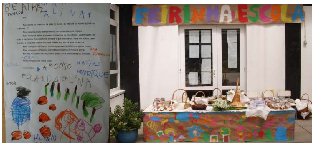
Figura 1: Carta e banca da Feirinha

Alguns aspetos de educação financeira foram trabalhados naturalmente de modo implícito: os bens materiais custam dinheiro; o dinheiro pode ser obtido com trabalho na concretização de ideias, como a confeção dos biscoitos e compotas para realização da feirinha; o dinheiro deve ser acumulado/poupado para adquirir um bem; novos ciclos de trabalho têm de ser concretizados para obter mais dinheiro e atingir o objetivo definido.