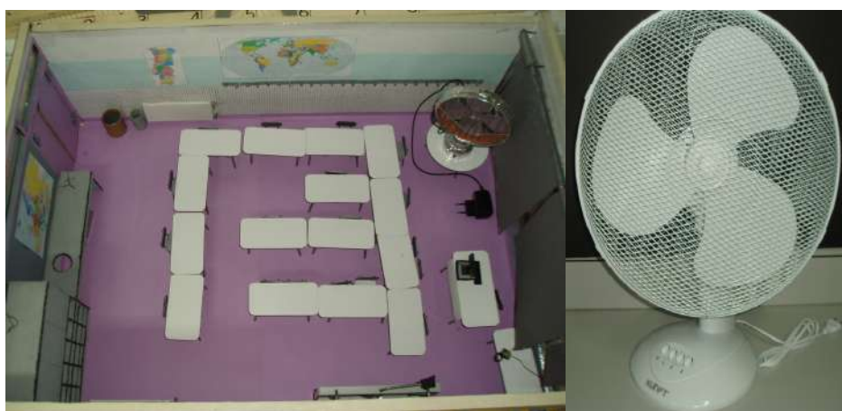
Figura 2: Protótipo de sala e ventoinha adquirida

Até ali tudo tinha corrido bem. O que poderia correr mal? “A ventoinha podia não funcionar (aluna, 20 de abril de 2015)”. Mas funcionou.